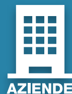
TABELLE E CCNL